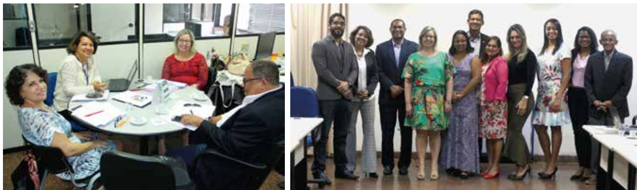
Reuniões da Câmara Técnica e dos Coordenadores de Comissões Técnicas do CRCBA (à direita).

Em 2018, a Câmara Técnica do CRCBA planejou a revisão da norma que dispõe sobre o funcionamento das comissões de estudos técnicos e grupos de trabalho, bem como a reestruturação da composição destas. Assim, foi possível revisar o regulamento que disciplina o Programa de Estímulo à Pesquisa Científica Prof. Wilson Thomé Sardinha Martins e também criar uma agenda de cursos técnicos disponibilizados para a classe contábil.