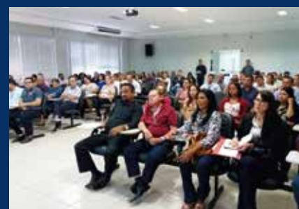
Palestra "Contabilidade para Pequenas Empresas e Alterações do Simples Nacional" (Barreiras, 06/2/18);

Como quase todos os cursos, palestras, seminários e encontros do CRCBA não têm contrapartida financeira como taxa de inscrição, são arrecadados donativos com os participantes, que resultam em uma importante contribuição social da classe contábil baiana. Até novembro de 2018, foram arrecadados 761 quilos de alimentos, 2.440 latas de leite em pó, 331 fraldas geriátricas e 406 kits escolares/briquedos nos eventos do CRCBA, doados a instituições beneficentes da capital e do interior do estado. 94% dos participantes avaliaram os eventos como ótimos ou bons.