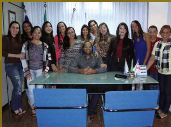
Visita dos alunos da Faculdade Santíssimo Sacramento, de Alagoinhas.

A Comissão de Jovens Lideranças Contábeis da Bahia integra a comissão nacional do Conselho Federal de Contabilidade e atua no intuito de despertar e fortalecer lideranças na profissão contábil, desenvolver ações empreendedoras e promover a participação social. Na Bahia, são realizadas palestras de educação financeira para instituições beneficentes que atendem famílias carentes; visitas às instituições de ensino superior para mobilização da importância da atuação profissional regular; recepção de turmas de estudantes na sede do conselho, para apresentação dos projetos desenvolvidos pela entidade e dicas de colocação no mercado contábil; ações durante os Exames de Suficiência; dentre outros.