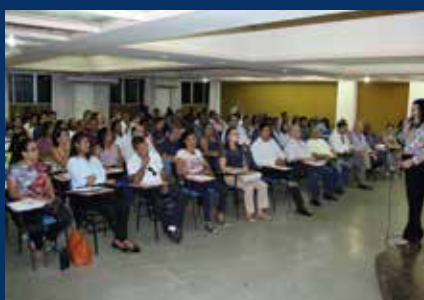
Palestra "Alterações do Simples Nacional" (Salvador, 23/1/18);