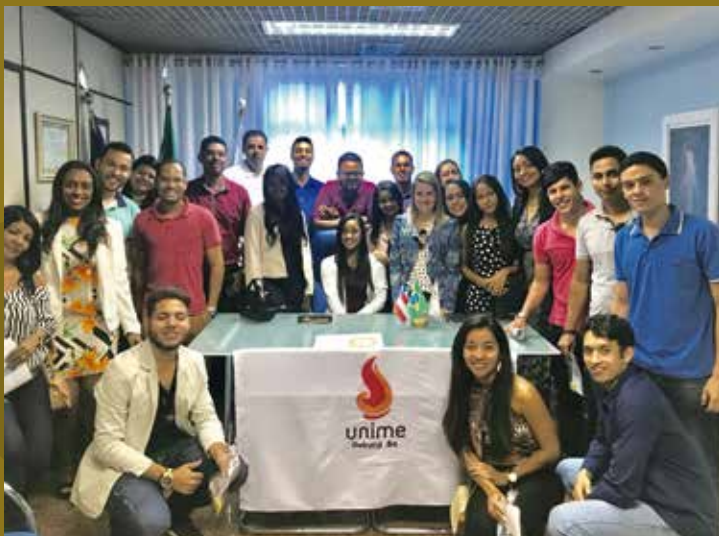
Visita de alunos da UNIME de Lauro de Freitas.