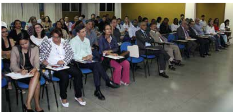
Audiência com Secretário de Desenvolvimento e Urbanismo de Salvador – SEDUR, 22/08.