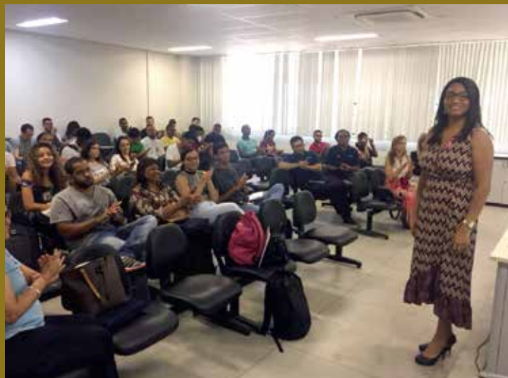
Visita à Faculdade de Ciências Contábeis da UFBA.