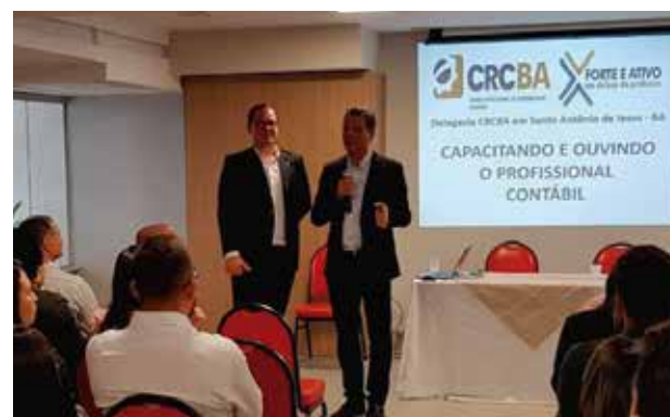
Audiência pública para levantar as demandas dos profissionais de Santo Antônio de Jesus, 14/08.