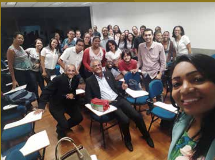
Visita a turma de Ciências Contábeis do Centro Universitário Jorge Amado – UNIJORGE.