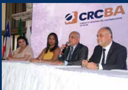
IV Jornada do Conhecimento Contábil e Tributário (Salvador, 20/3/18);

De janeiro a novembro de 2018, foram realizados 101 eventos de Educação Continuada pelo CRCBA, sendo 41 na capital e 60 no interior. Participaram destes eventos, 5.794 pessoas, dentre profissionais contábeis (3.037), estudantes de Contabilidade (1.583) e profissionais de outras áreas (1.174).