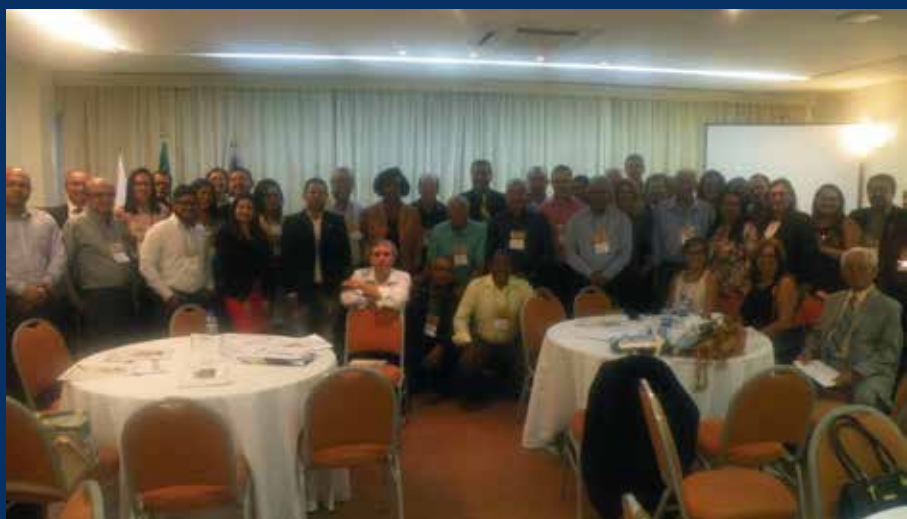
Reunião de delegados e Coordenadores regionais, realizada no dia 19/03/2018, em Salvador.

Continuando o trabalho de aperfeiçoamento de habilidades, no dia 07 de novembro, o CRCBA realizou treinamento para delegados em Salvador, oportunidade em que foram apresentadas as rotinas dos setores de Atendimento, Registro, Fiscalização e Desenvolvimento Profissional, sobretudo aos representantes que ocuparam o cargo há menos tempo. Para que o Conselho alcance os objetivos, é crucial que os delegados estejam qualificados para atender às demandas da classe contábil no interior do estado, em consonância com as premissas estabelecidas pelo Órgão.